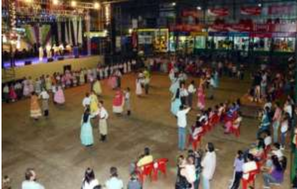
En la apertura de la Expo Santa Rita la gente pudo disfrutar de números artísticos presentados por el elenco del CTG Indio José.

Con excelentes expectativas en cuanto a participación e ingresos arrancó anoche la XXI edición de la Expo Santa Rita con 550 expositores. La muestra, considerada una de las más importantes del interior del país, permitirá mostrar a los visitantes el potencial productivo de Paraguay, especialmente del Alto Paraná, en cuanto a ganadería, industrias, firmas agroexportadoras y de servicios.